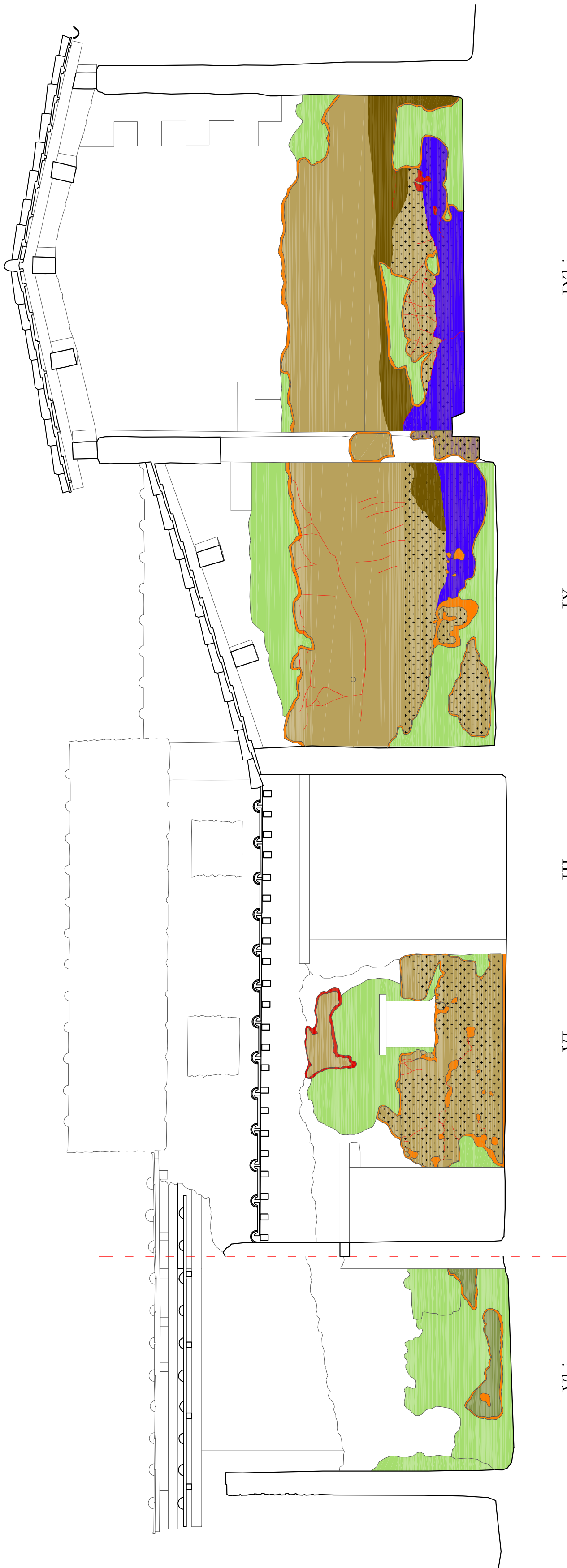
SEZIONE 1 scala 1:50